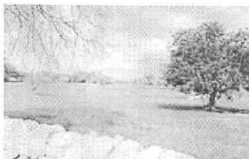
Una veduta della campagna modicana. Da oggi nuove regole per le compravendite dei terreni

La Giunta ha approvato nei giorni scorsi uno specifico atto di indirizzo, modificando in particolare gli oneri relativi ai diritti di segreteria dovuti per il rilascio dei certificati di destinazione urbanistica, necessari per la compravendita dei terreni. Sulla scorta dell'atto deliberativo gli oneri sono calcolati, non più in base all'estensione in metri quadri della particella, sul numero delle particelle richieste. "Nella pratica - è spiegato in delibera - in base alla delibera di Giunta che nel 2011 fissò le precedenti tariffe, utilizzando come parametro la superficie delle particelle interessate, il calcolo delle superfici comportava un aggravio